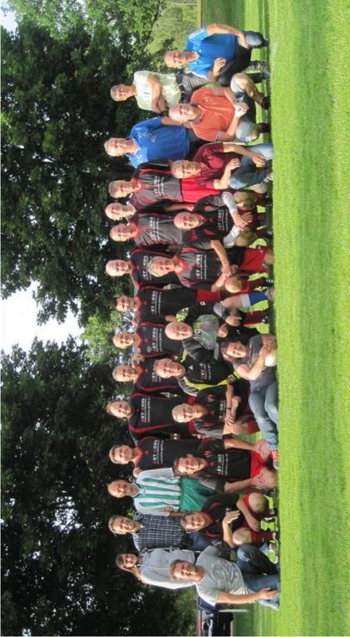
Die AH-Mannschaft des SC March