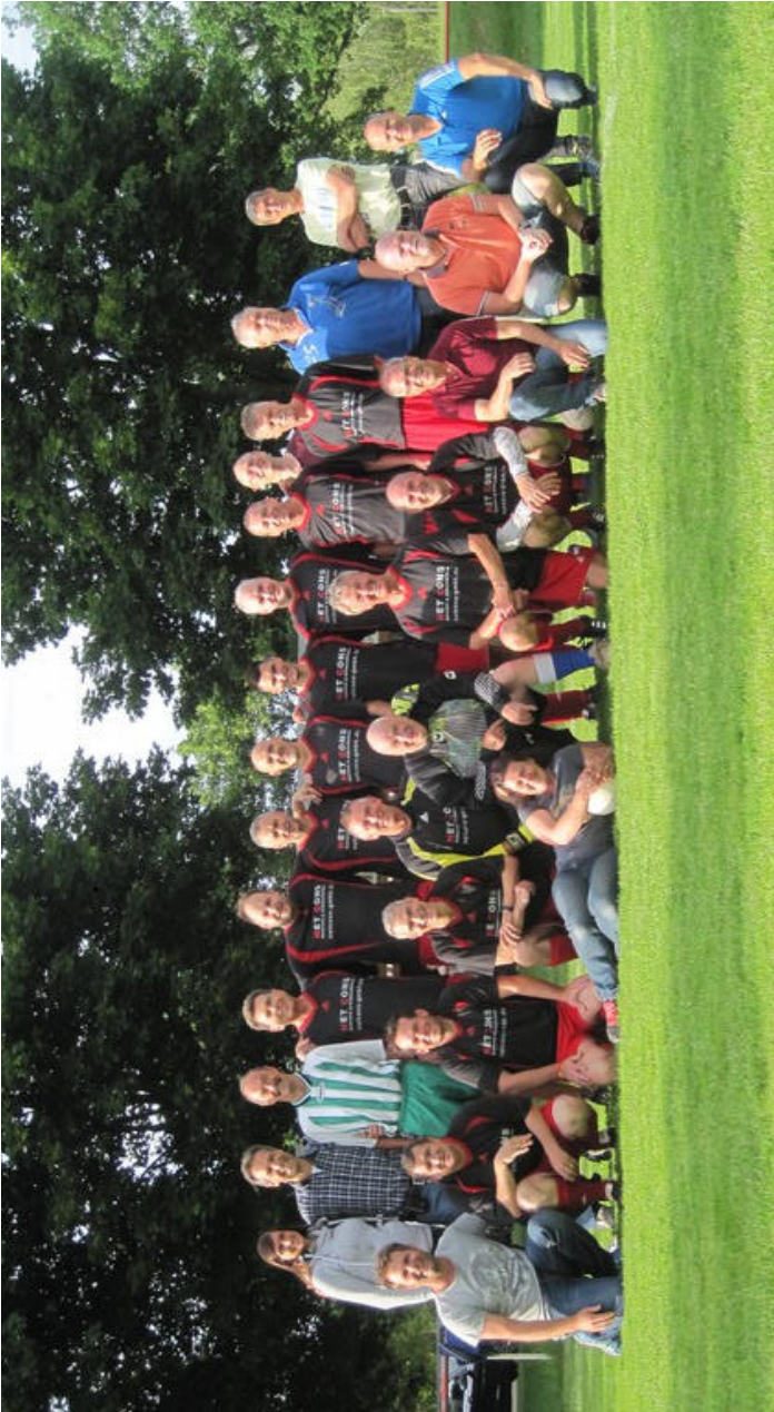
Die AH-Mannschaft des SC March